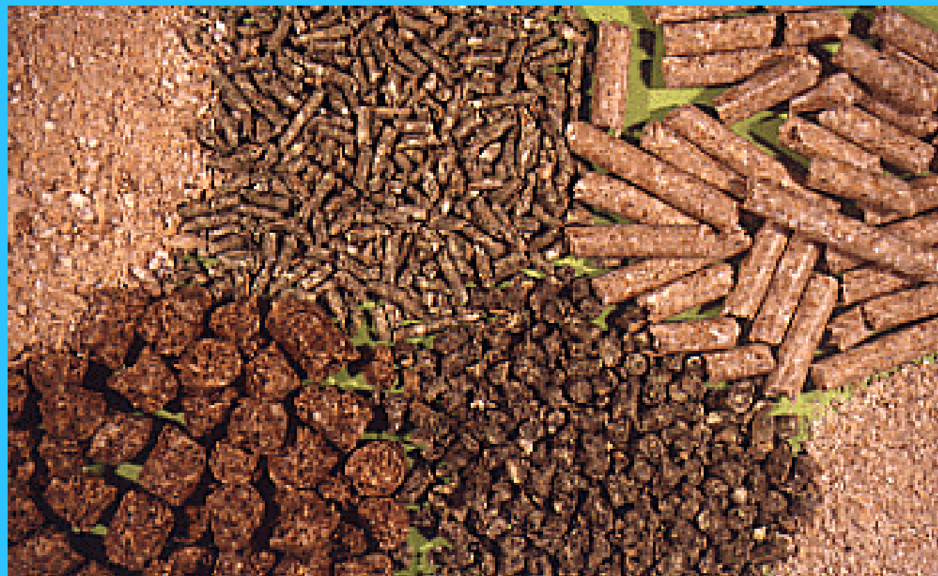
各种动物不同形状的饲料成品