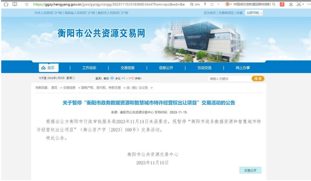
图 4：“衡阳市政务数据资源和智慧城市特许经营权出让项目”被暂停