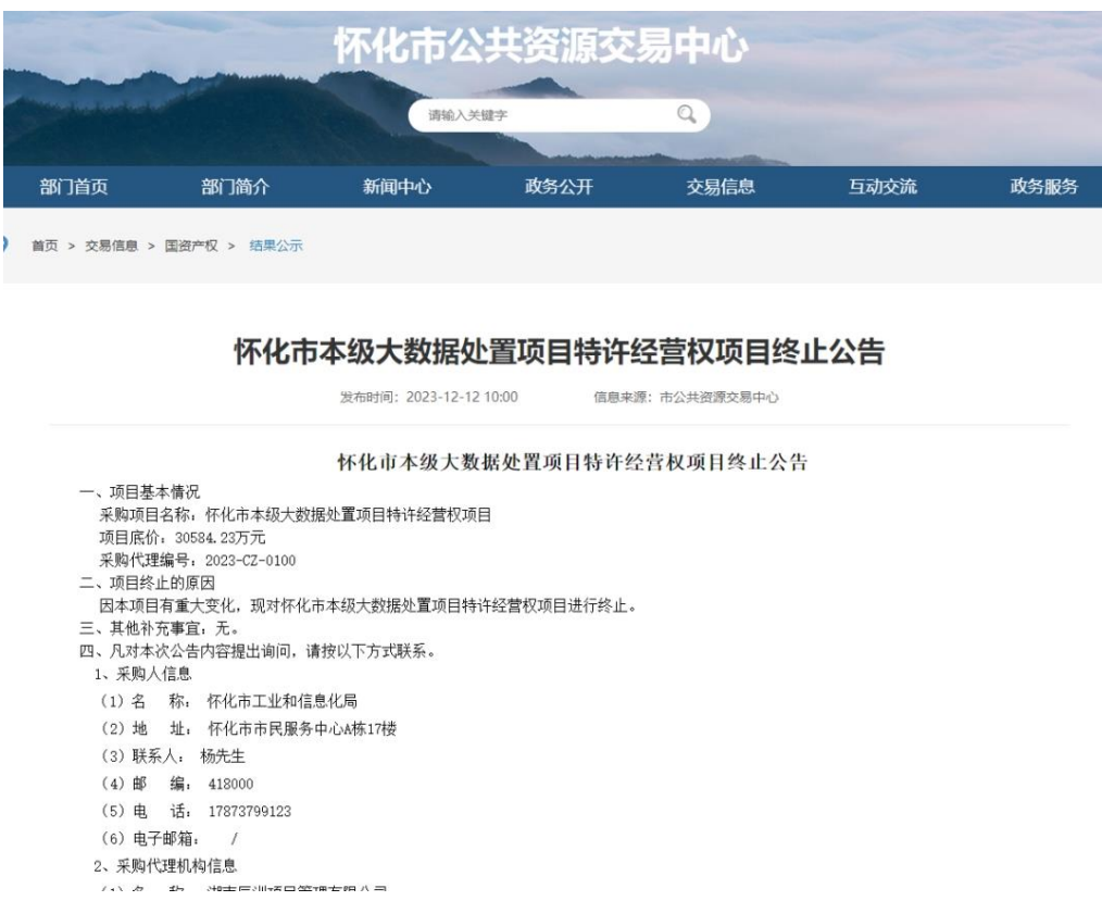
图 5：怀化市本级大数据处置项目特许经营权项目终止