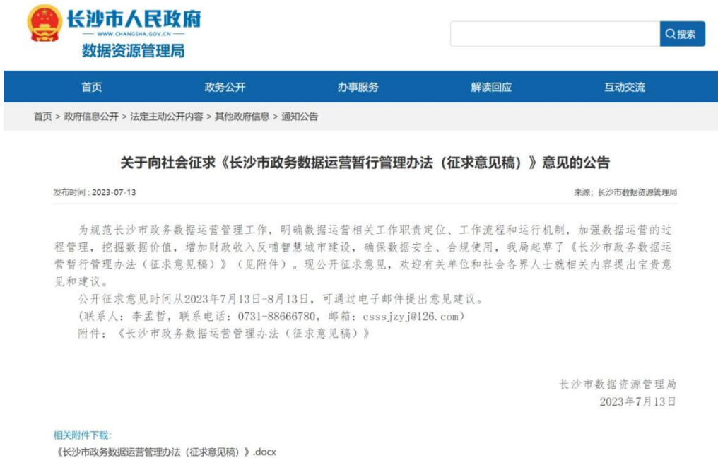
图 3：《长沙市政务数据运营暂行管理办法（征求意见稿）》公布