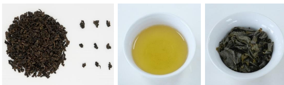
表 2 浓香型安溪铁观音感官指标