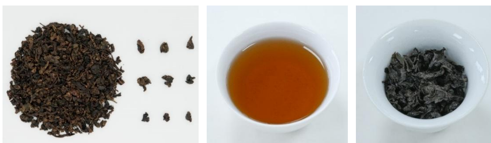
表 3 陈香型安溪铁观音感官指标