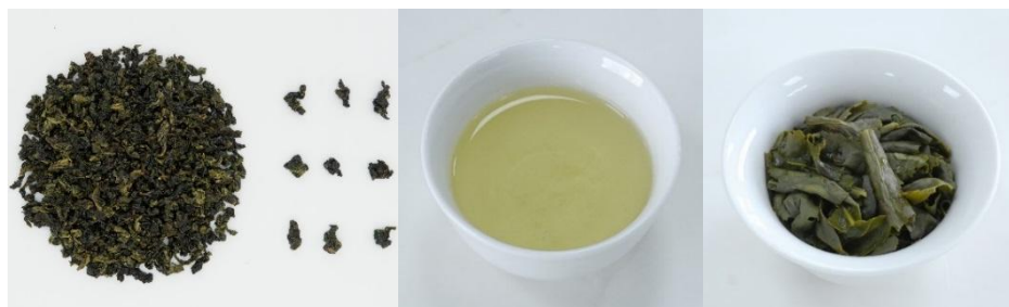
表 1 清香型安溪铁观音感官指标