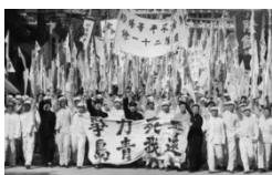
五四运动游行队伍

5. (2023 江西模拟)老照片能够折射历史。从下面一组老照片中，我们可以感悟到共同历史内涵是( )