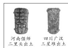
图 1 镶嵌绿松石铜牌