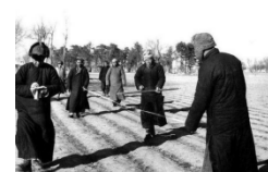
翻身农民丈量分配土地