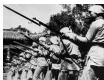
活跃于冀中平原的回民支队