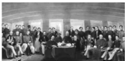
图1 1842年《南京条约》的签订情景