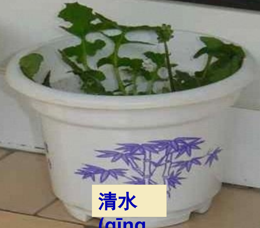
清水 (qīng shuǐ)