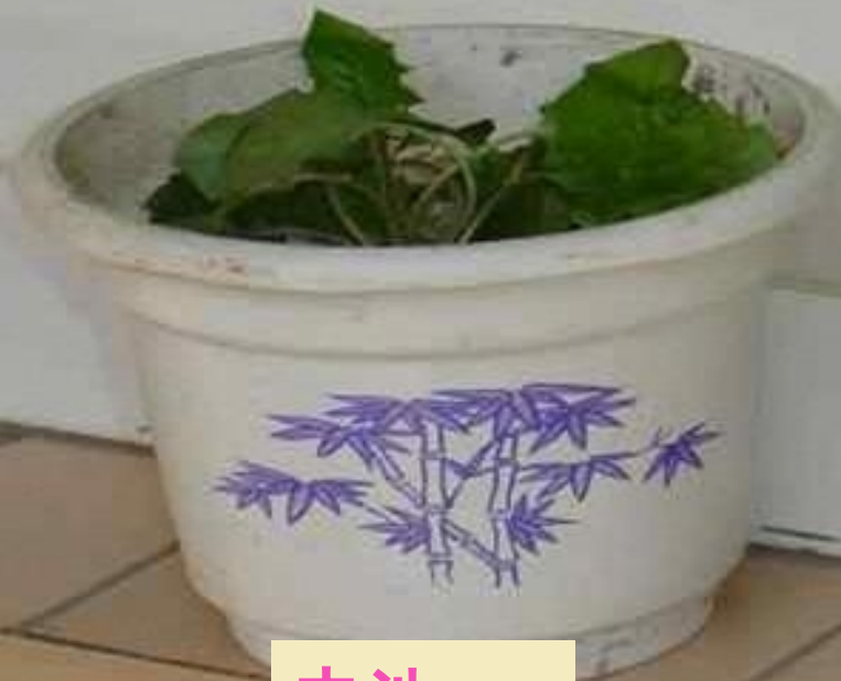
电池 (diànchí) 液