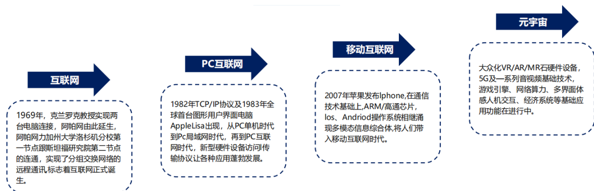
图表：元宇宙的发展历程

元宇宙 (Metaverse)：是一个与现实世界平行的线上虚拟世界，其核心在于对虚拟资产和虚拟身份的承载。