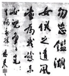
1939年周恩来在绍兴的题词

2. 请赏读下面这幅书法作品，选用其中合适的四字词语，填入诗句点评的空缺处。（2分）