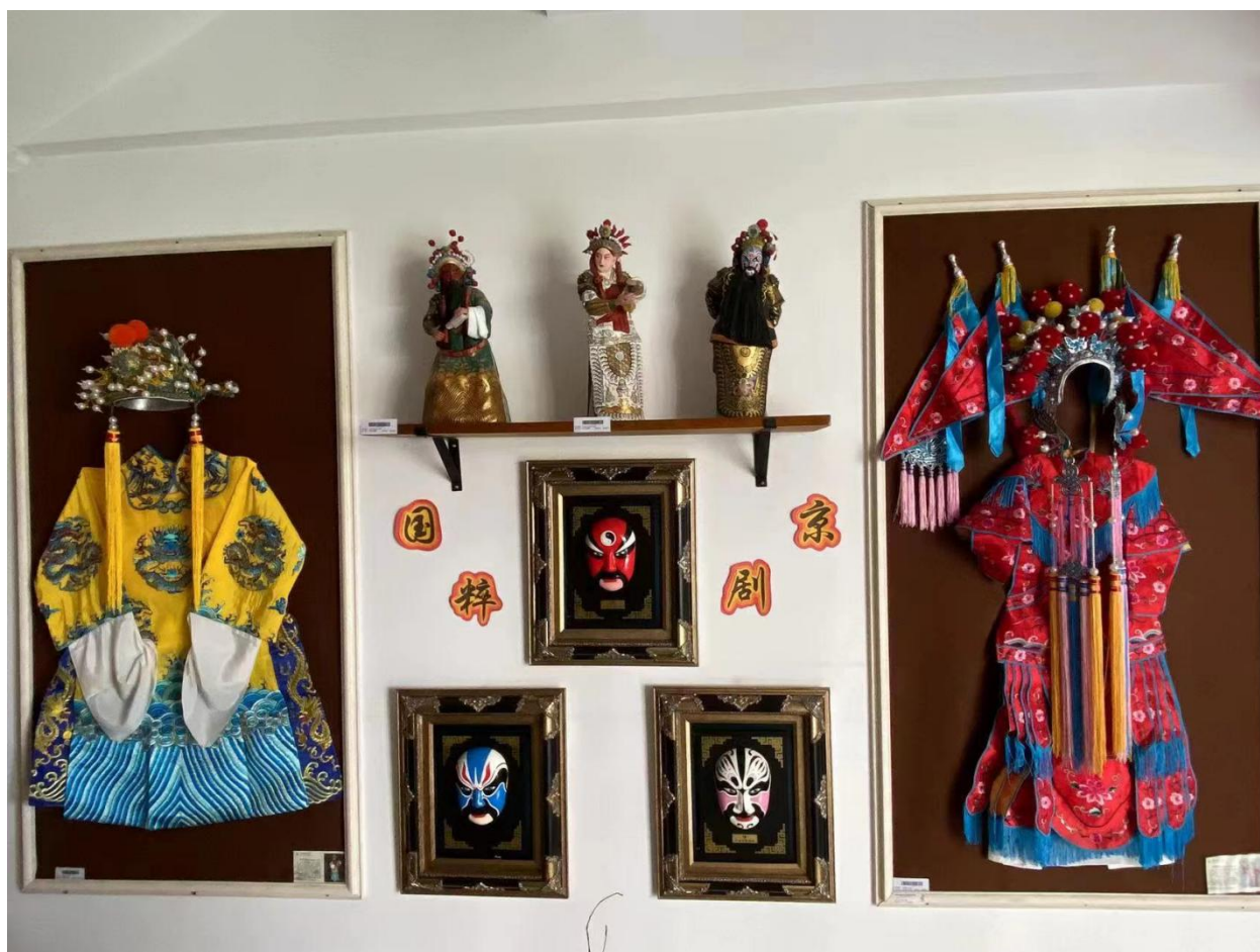
图 2-1 民族特色服饰展示图

本研究在研究时，首先确认选题，然后在实习的过程中，对幼儿、教师、园长、家长以及社区工作人员进行观察和访谈，并且积极沟通。同时也关注环境创设的结果以及成效。下面的几张图是在进行观察时所拍摄的。最后再把所有的材料整合，进行论文的撰写。