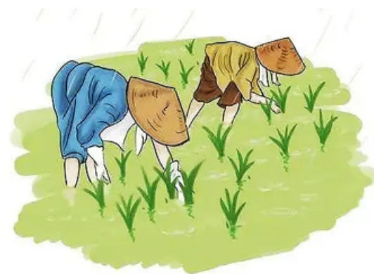
看似后退，实为前进