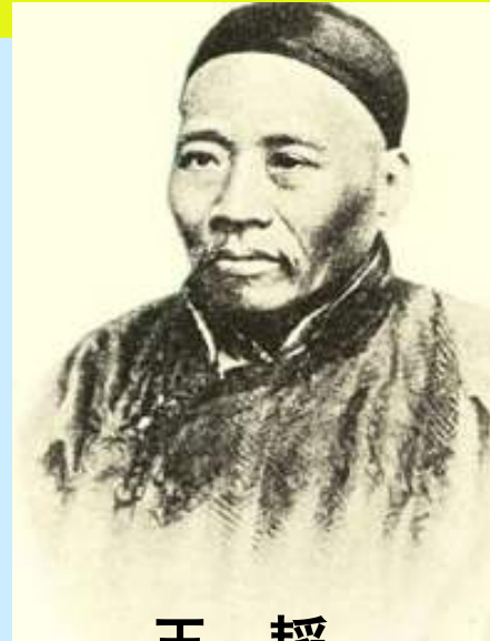
王 韜 郑观应

早期维新派开始对中西文化的体用关系进行深刻反思，其中的佼佼者进而提出改良政治、实行君主立宪制度的要求。