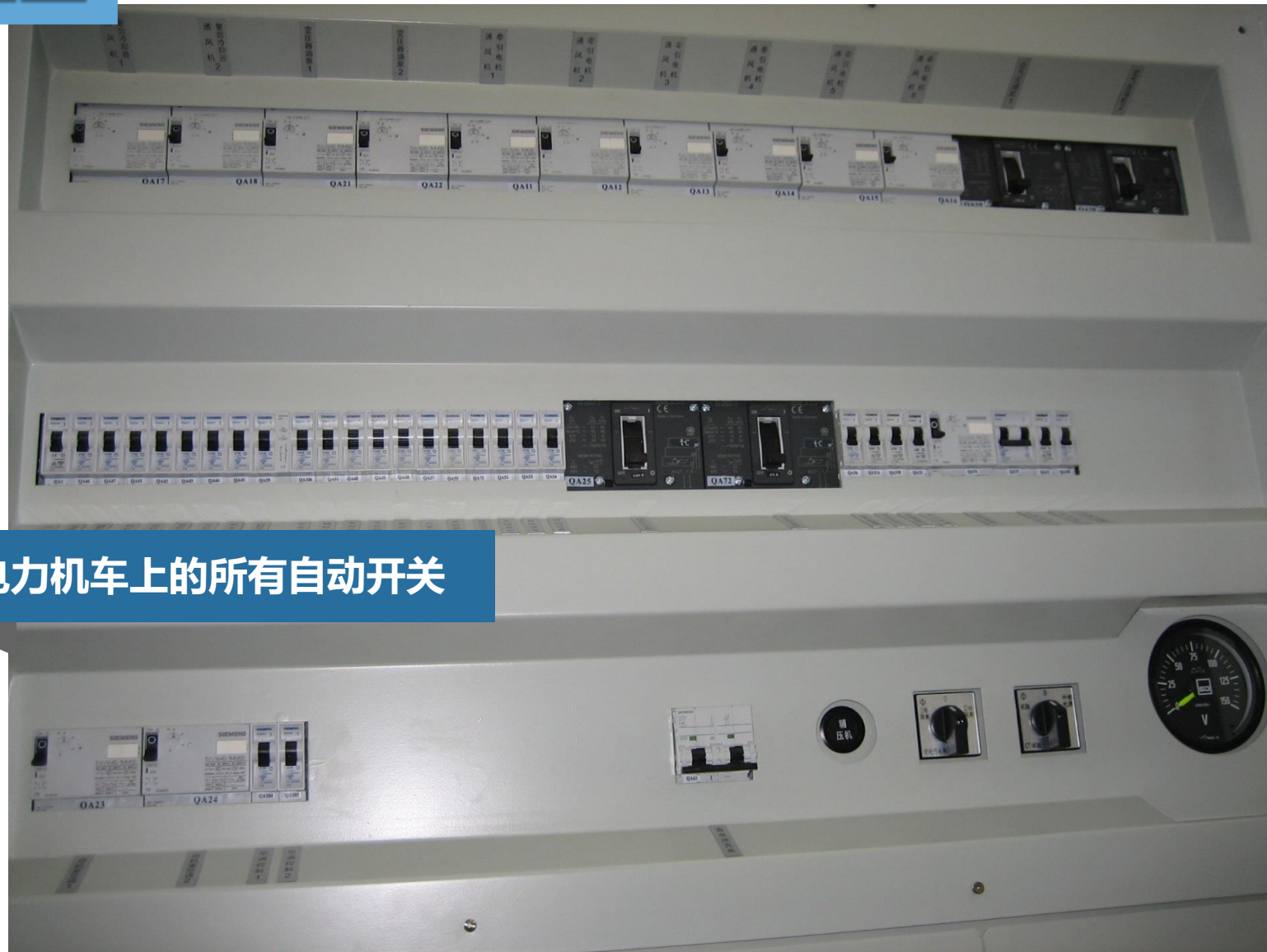
电力机车上的所有自动开关