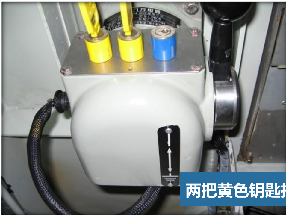
两把黄色钥匙插入