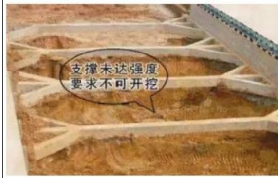
支护结构必须达到设计要求的强度后才能开挖下层土方

8.1.1当支护结构构件强度达到开挖阶段的设计强度时，方可向下开挖；对采用预应力锚杆的支护结构，应在施加预加力后，方可开挖下层土方；对土钉墙，应在土钉、喷射混凝土面层的养护时间大于2天后，方可开挖下层土方；开挖至锚杆、土钉施工作业面时，开挖面与锚杆、土钉的高差不宜大于500mm