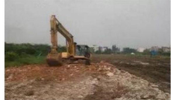
软土场地，先采取有效措施防止机械下陷