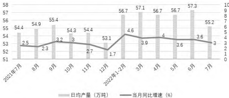
图1 全国规模以上工业原油产量月度走势