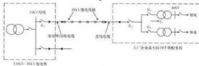
图1 一次系统接线图

大部分工厂企业及居民小区用电是10kV供电,并设置配电房,一般情况下一个配电房安装一台或二台10kV/400V的配电变压器,用380V/220V电压供用户用电,一次系统接线图,如图1。