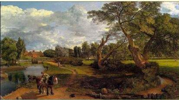
工业革命前的英国乡村小镇

“这是最好的时代，这是最坏的时代；这是智慧的时代，这是愚蠢的时代；这是信仰的时期，这是怀疑的时期；这是光明的季节，这是黑暗的季节；这是希望之春，这是失望之冬；人们面前有着各样事物，人们面前一无所有；人们正在直登天堂，人们正在直下地狱。”