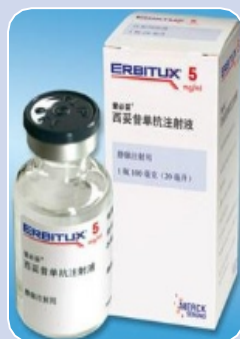
西妥昔单 抗/爱必妥