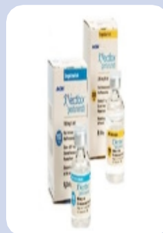
帕尼单抗/ 维克替比