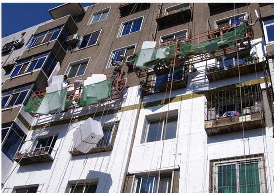
北方地区：屋顶坡度较小，墙体厚