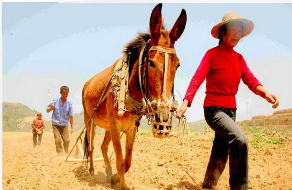
北方地区：以旱地为主