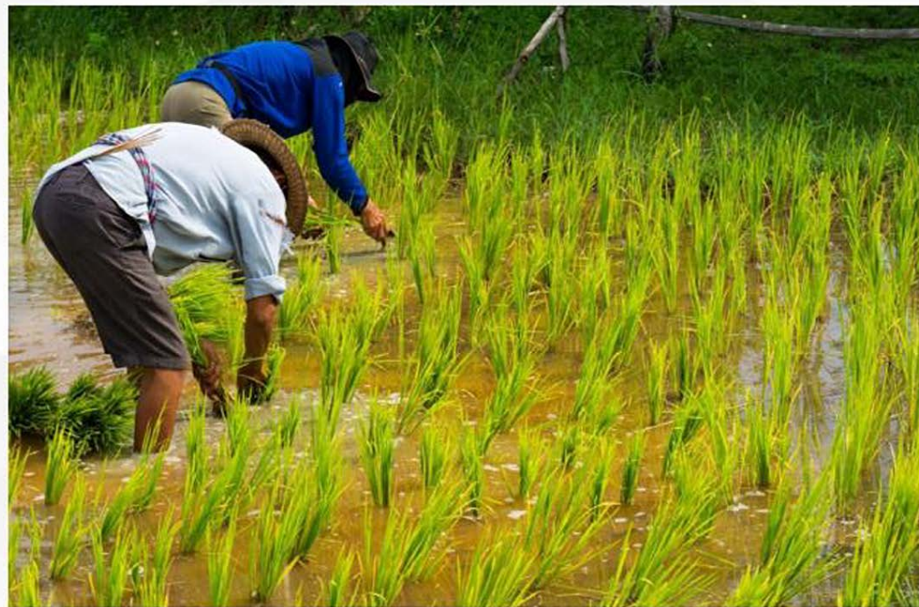
南方地区：以水田为主