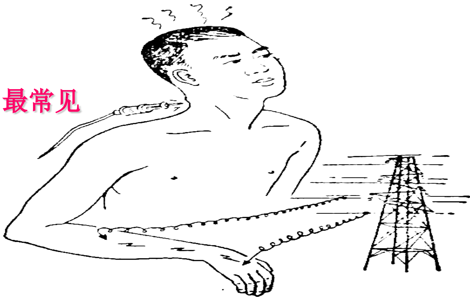
图 70-20 颈椎病神经根型症状示意图