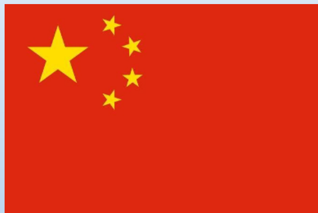
中华人民共和国国旗——五星红旗