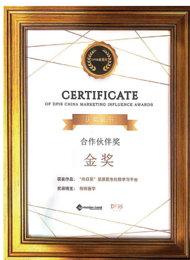
金營獎2022 — 最佳合作夥伴獎