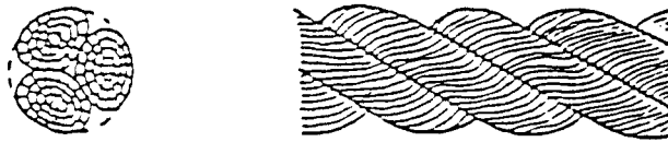
图 1 三股绳索(A 型)的形态图