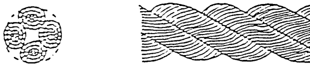
图 2 四股绳索(B 型)的形态图