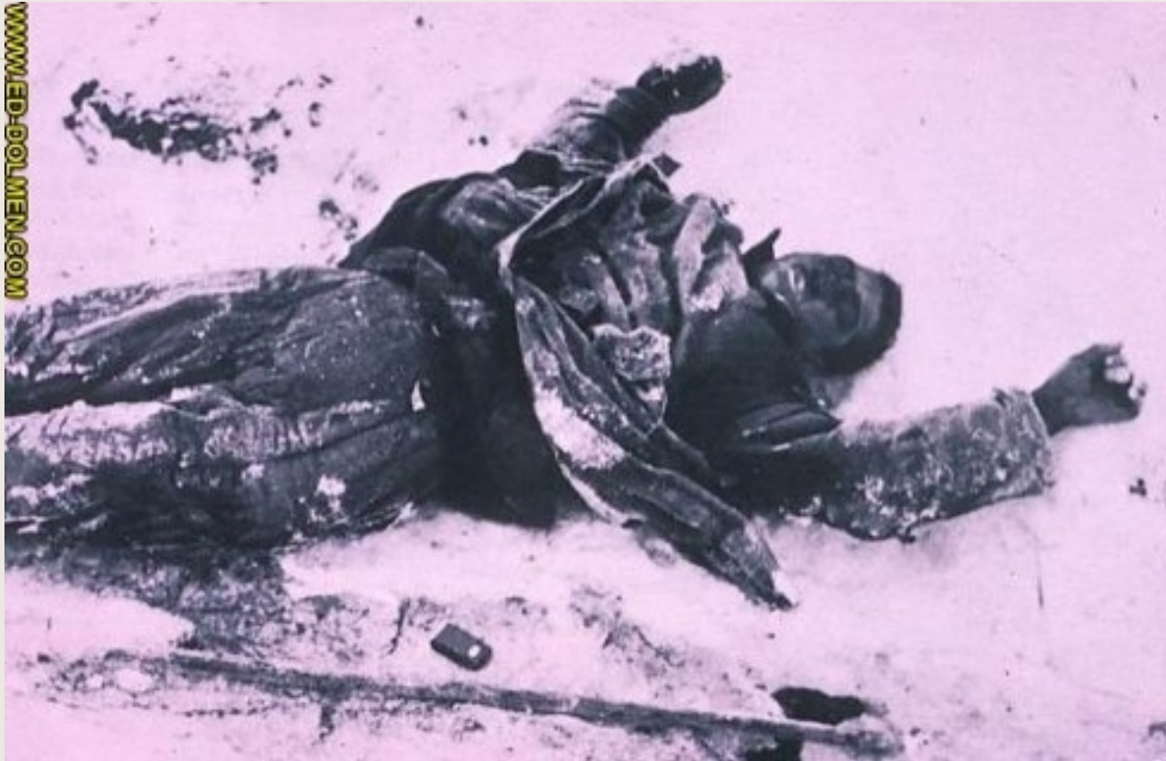
苏联红军士兵的尸体.