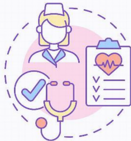
A Research Nurse

护理科研是推动护理学科发展的重要动力，通过科研可以不断创新和完善护理理论、方法和技术，提高护理质量和效率，促进人类健康事业的发展。