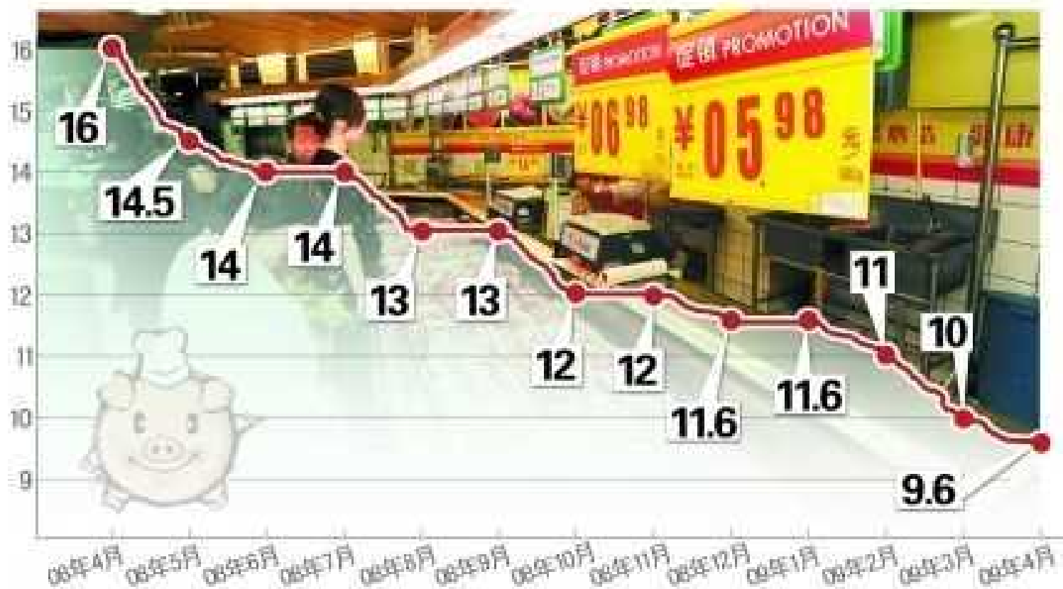
2008年4月至2009年4月生猪平均价格变化情况(单位:元/千克)