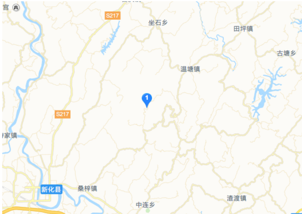
项目区生态红线图