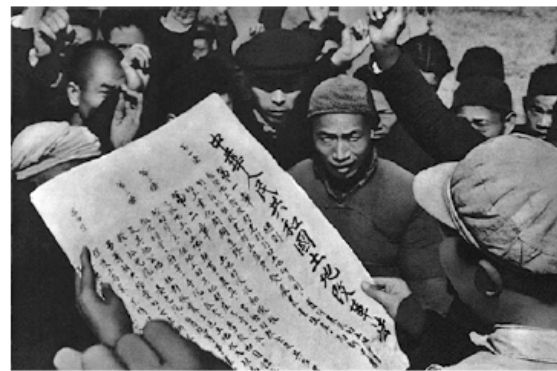
图二 《中华人民共和国土地改革法》受到广大农民的热烈拥护