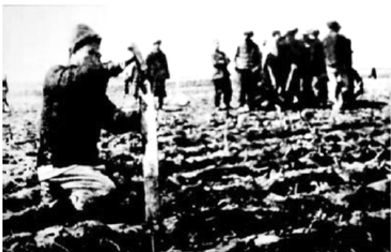
图一 解放战争时期解放区农民在分到的土地上插界标

4. ★★ 中国共产党历来重视农民、农业和农村问题。图一、图二体现的历史事件的共同之处是（ ）