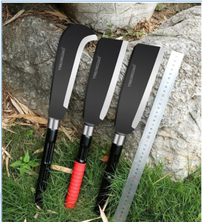
柴刀：常用于剖竹子等坚硬的材料