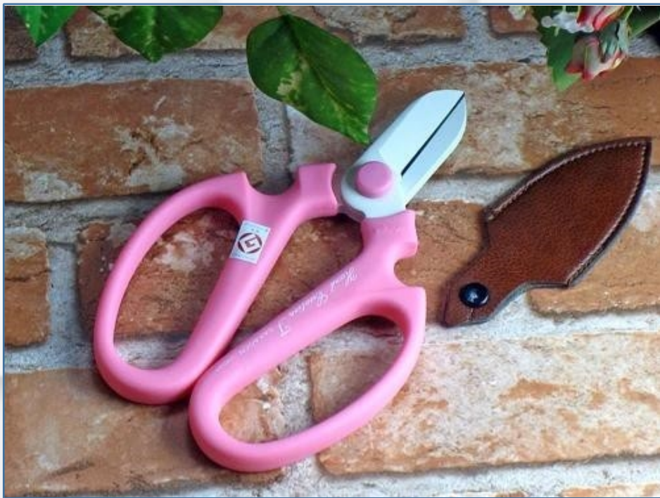
剪刀：用于修剪草本等易剪花材