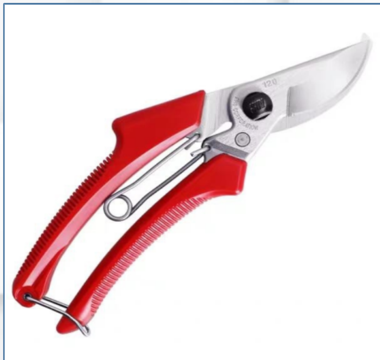
枝剪（园艺剪）：用于修剪木本枝条等硬枝叶材