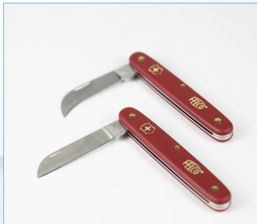
花艺刀:用于截短草本花材茎干