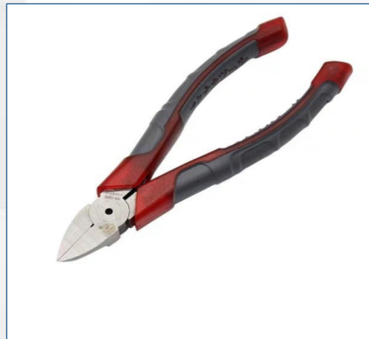
斜口钳：用于处理铁丝、铝丝、铜丝等金属丝