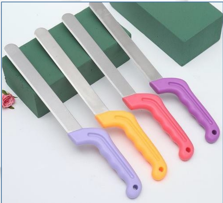
花泥刀:用于切割花泥