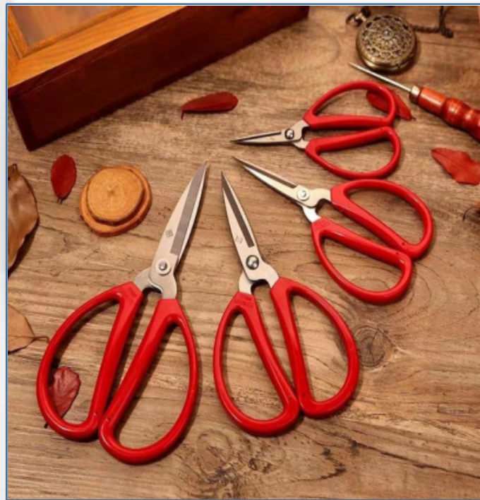
丝带剪：用于剪切插花丝带和包装纸