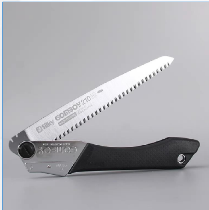
锯子：常用来分割粗大的木本枝材