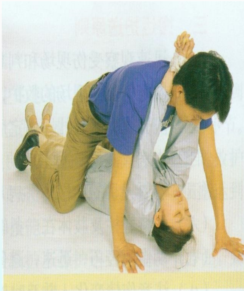
图 3-82 爬行法