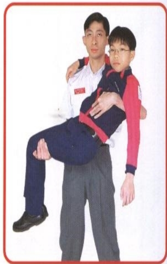
图 78 手抱法