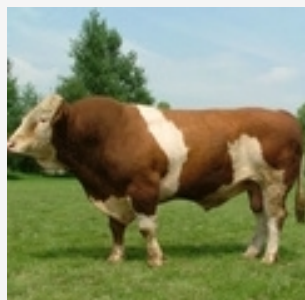
牛 > 50头