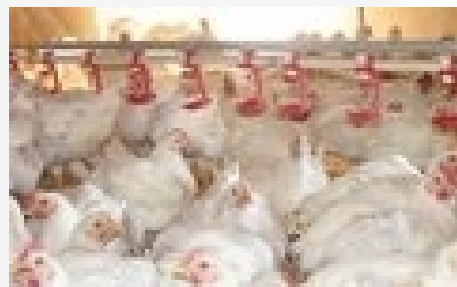
鸡、鸭 > 5000羽