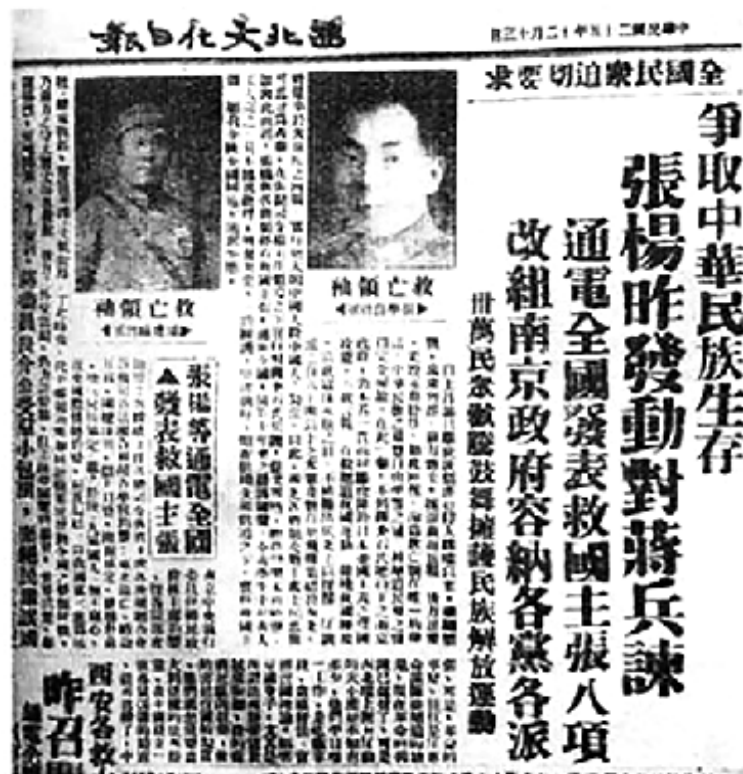
1936年12月21日西安報以關於西安事變的報導