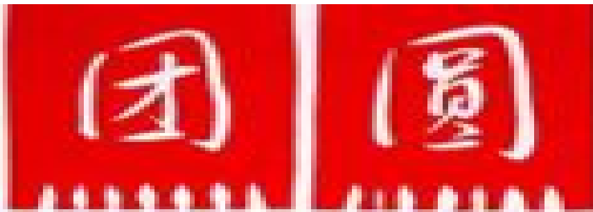
文 / 张其成