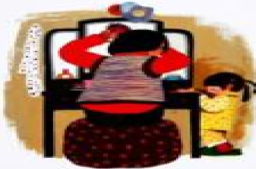
爸爸在外面盖大房子。

父亲在外面盖大房子。 他每年只回家一次，那就是过年。 今天，妈妈和我都起得尤其早，因为——