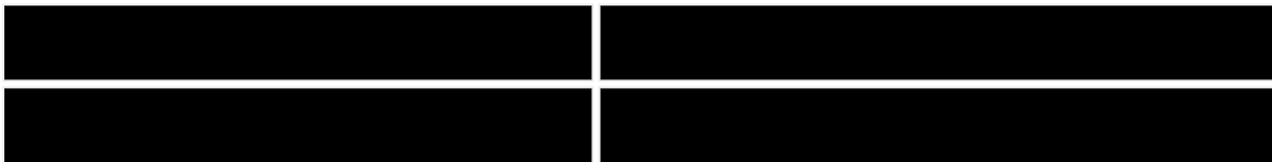
图2 果汁和蔬菜汁饮料产量增速表格