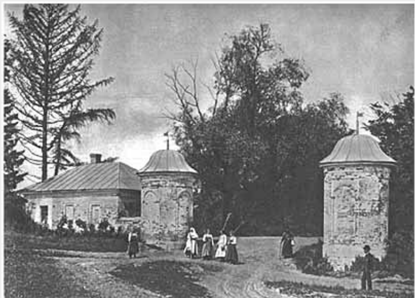
雅斯纳亚·波良纳庄园