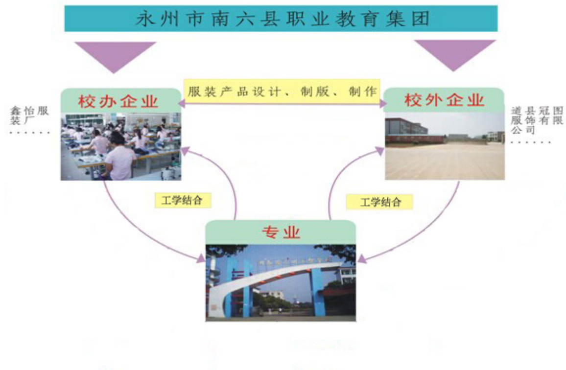
图 1：服装设计与工艺专业“专业+公司”的工学结合人才培养模式框架图

“专业+公司”的工学结合人才培养模式以“理实一体、校企互动”为特征，以服装行业的岗位需求为依据，以职业能力为主线，校企双方共同围绕理论与实践教学，以服装产品种类的“设计-板型-成衣”的工作过程为教学主线，对岗位能力分析构建课程体系，以企业真实的产品为载体基于工作过程重组教学内容，在综合实训、生产性实训中以项目作为任务，每个项目按照咨询（信息收集）、决策（分析决策）、计划（计划安排）、实施（项目实施）、检查（项目检查）、评估（评价改进）六步进行设计，理实一体，提高学生的综合能力。