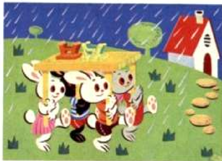
兔子搬家 草马心画