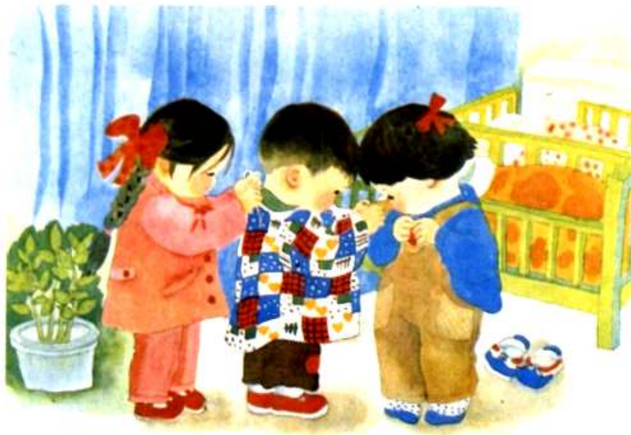
都是好孩子 黄毅民画