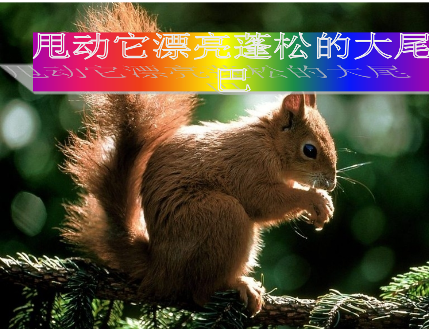
甩动它漂亮蓬松的大尾巴 甩动它漂亮蓬松的大尾巴