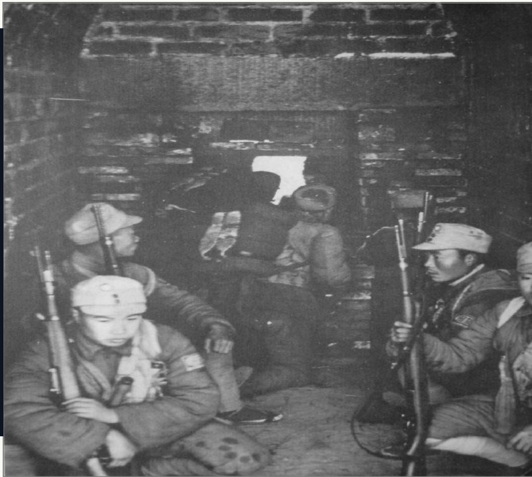
第三次长沙之战中守卫长沙古城垣的第9战区士兵

“此次会战，中日双方伤亡均重，日方的损失更大。中国军队的战报说：日军仅在战场上就遗尸56900多具，其中有大队长，联队长以上军官10人；被俘者139人。被俘人数之多，为历次会战所罕见。”