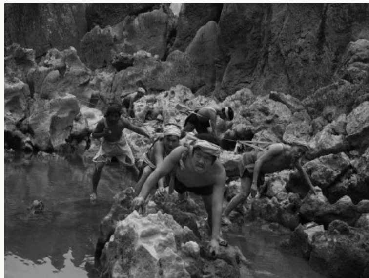
川江岸上的转战物资