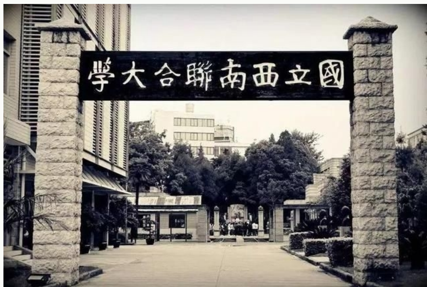
国立西南联合大学