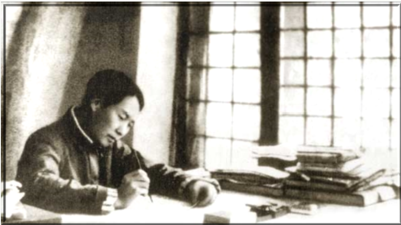
毛泽东写《论持久战》