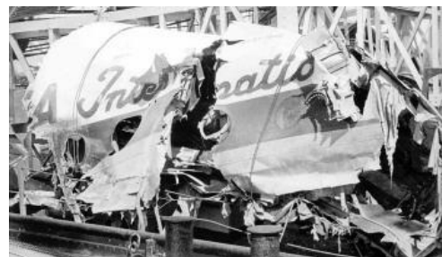
“克什米尔公主号”事件