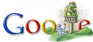
St. George's Day (UK)