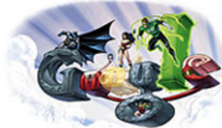
DC Comics (US)