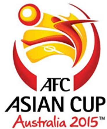
2015年澳大利亚亚洲杯会徽