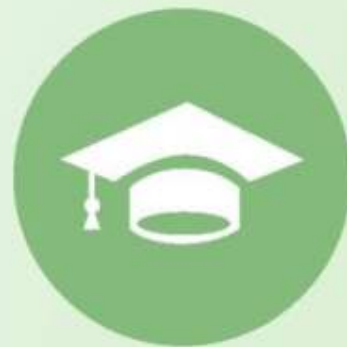
组织结构的系统性

组织的目标需要分解为各个子目标，子目标之间相互协调、相互支持，共同实现整体目标。