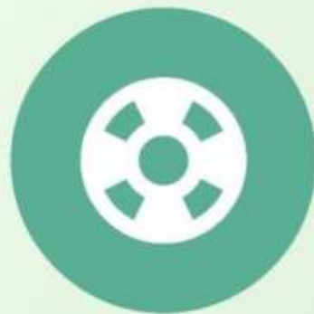
组织目标的系统性

系统原理强调将组织视为一个整体，各个部分之间相互关联、相互影响。管理者需要从整体的角度出发，全面考虑组织内外部环境，以实现整体的最优化。