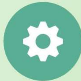
组织管理的系统性

组织的各个部门、岗位需要明确职责和权限，形成协调一致的组织结构，以确保组织的稳定和高效运作。