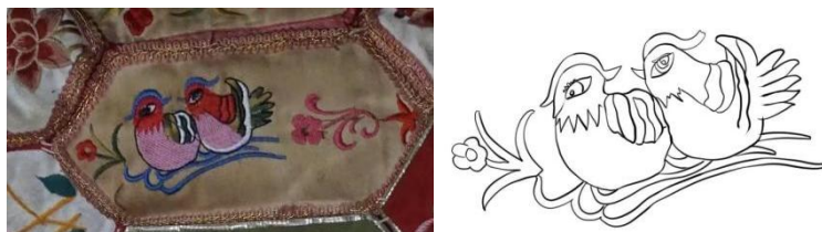
图 4.5 鸳鸯纹 右\鸳鸯纹线稿