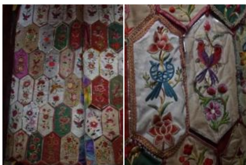
图 3.3 左\周氏祖堂内的百花帐 右\对鸟纹