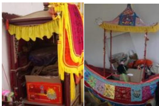
图 2.3 尘封在角落里的轿子

在游春的过程中，因为轿子比较重，需要年轻力壮的人抬轿，因此村庄会请年轻力壮的小伙子负责抬轿，游春的主角是元福主与邹太婆，南阳乡有十几个村庄，每个村庄都设有人们自己的家族姓氏宗祠，元福主与邹太婆在游春的过程中会前往这些村庄去巡视、赐福纳喜，并在每个村庄的宗祠里停留过夜，护佑百姓平安幸福。随着时代的进步与社会的发展，村庄里的年轻人大部分都外出工作生活，导致游春时无人抬轿，致使轿子常年放在寺庙里，游春轿子也早已布满了尘土。