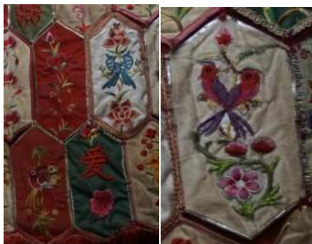
图 4.4 百花帐对鸟纹

与自然图案进行组合构图，这无不与当地百姓“驱灾辟邪”意愿相符合。“对鸟纹”更是表现了瑞昌百姓对天地生灵的敬畏以及对美好愿望的祈求。