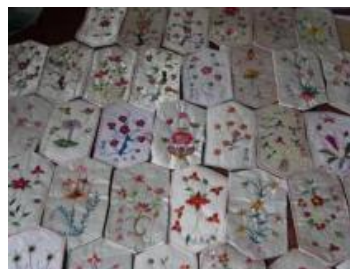
图 3.2 百花帐绣片