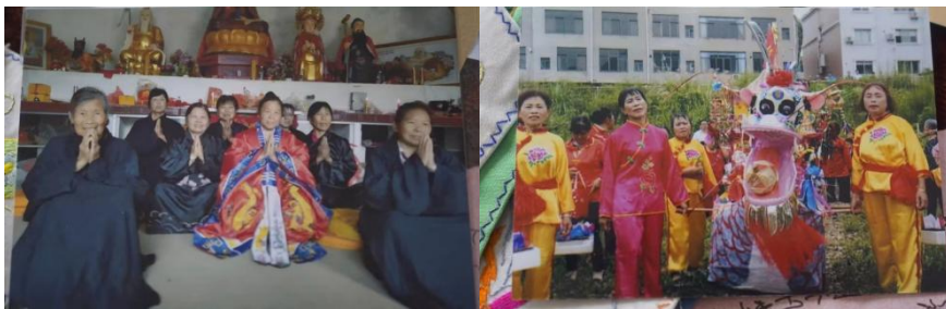
图 2.2 仪式活动的旧照