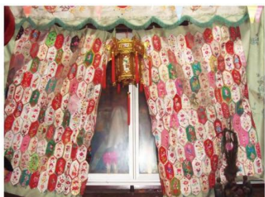
图 3.1 瑞昌百花帐