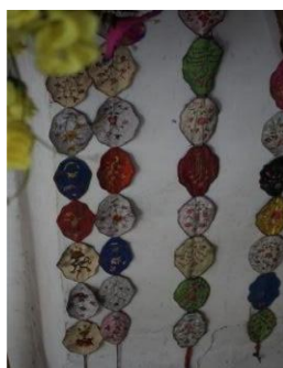
图 2.7 条串形百花帐