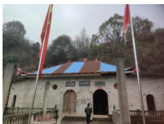
图 2.6 神仙洞

据南阳乡范镇村神仙洞的管理者周新妹讲述，原来用作元福主与邹太婆的百花帐轿帘如今也不在游春时期使用，而是常年放在寺庙或者宗祠里。现在游春轿子上的轿帘是用买来的机绣绣花布、印染花布来代替，不再是手工绣片组成的百花帐帐帘。轿帘不只是在材料上发生变化，在形式上也有变化，不同的地方百花帐的形式也是不一样。把周氏祖堂内的百花帐帐帘和神仙洞内的百花帐帐帘进行比较可以看出，周氏祖堂内的百花帐是由八十八片六边形的绣片缝合而成（如下图 2.8），据周爷爷说，一般在庙堂内的坐案左右两侧都会挂这种六边形的百花帐，只不过一面百花帐帐帘是由 50 片绣片缝合。而再看一下范镇村神仙洞内挂的百花帐是呈条串状形，每一条串帘由 10 片绣片缝合，一共有八条共计八十片绣片，这些串帘是还未缝合拼贴的百花帐绣片（如下图 2.7），而且这些百花帐串帘绣片不是按照传统习俗上的方胜形绣片或者六边形绣片的形式，而是按照八角边菱花形的绣片形式。