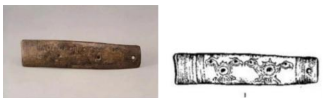
图 4.3 左\双头对鸟骨匕首 右\双头对鸟骨匕线稿

关于对鸟纹的具体定义与明确说法到目前为止没有详细的资料记载。田自秉先生在《染织纹样史》中涉及到的原始时代的“双鸟纹骨匕”（如图 4.3）、秦代的“树纹对鸟纹锦”、唐代的“对雉鸟纹织锦”、清代的“对凤纹盘”等文物品名，也大致是以两只鸟、或是两只具体品种鸟为主要纹样的模糊称谓 ① 。本文的“对鸟纹”属于祥瑞范畴，是祥瑞对鸟纹。