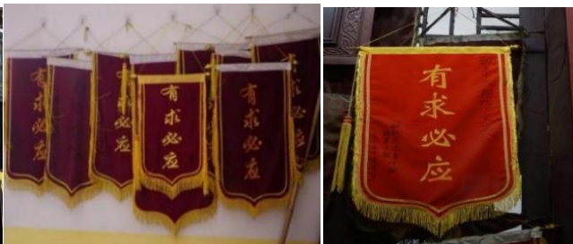
图 2.5 锦旗