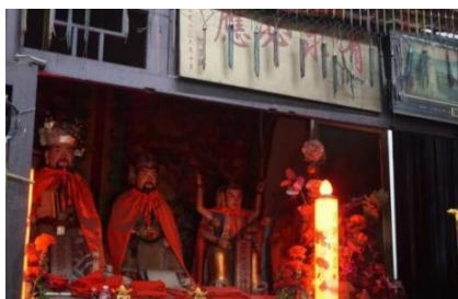
图 2.4 匾额