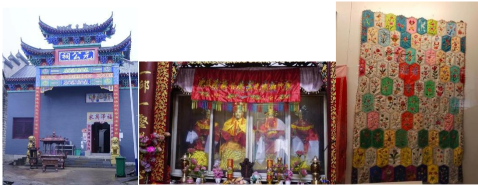
图 2.1 左\元公祠 中\福主菩萨 右\百花帐

又因苕夫人生前精通女红手艺，热爱剪纸、刺绣，于是当地百姓谋划制作百花帐用来纪念元结与苕夫人，在当地挑选一百名品行良好、刺绣剪纸技艺高超的未婚姑娘负责剪出方胜形（地方称菱形）的绣片式样，然后按照做好的纸样进行贴料刺绣，并书绣姓名花名交由寺庙，再由德高望重的手艺人将绣片缝合成百花帐（如图 2.1\右），由寺庙里最高管理者负责挂在元福主与邹氏娘娘的座案前作为帐帘。