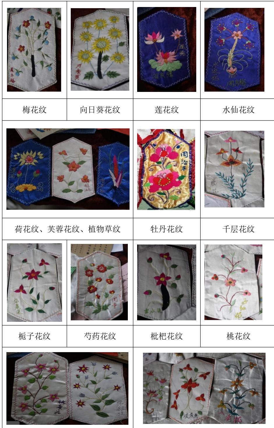
表 4.1 中部分百花帐花卉纹样