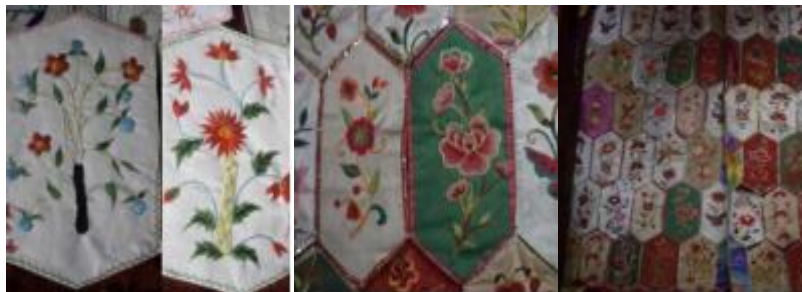
图 3.4 左/线条粗细对比 中/花瓣虚实对比 右/色彩对比

运用较多。在色彩选用方面（如图 3.4\右），花卉纹色调对比强烈，在百花帐纹样中，大部分花卉与植物躯干呈红配绿的基调，这样一定程度上提高了视觉效果。创作者通过运用对比的手法使得百花帐纹样精美绚丽，在百花帐中占据主体地位，同时也丰富了纹样结构造型，使得百花帐纹样整体视觉画面更加活泼生动，趣味盎然。