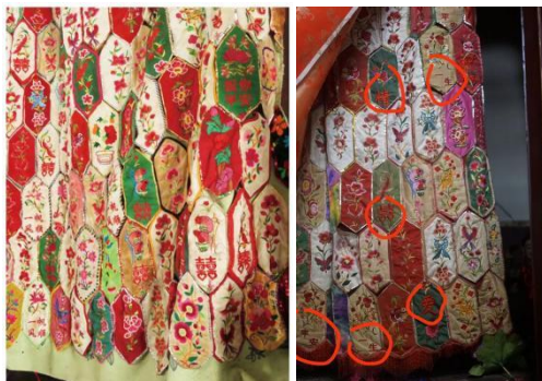
图 3.5 左\纹样居于中心位置 右\文字处于下方位置