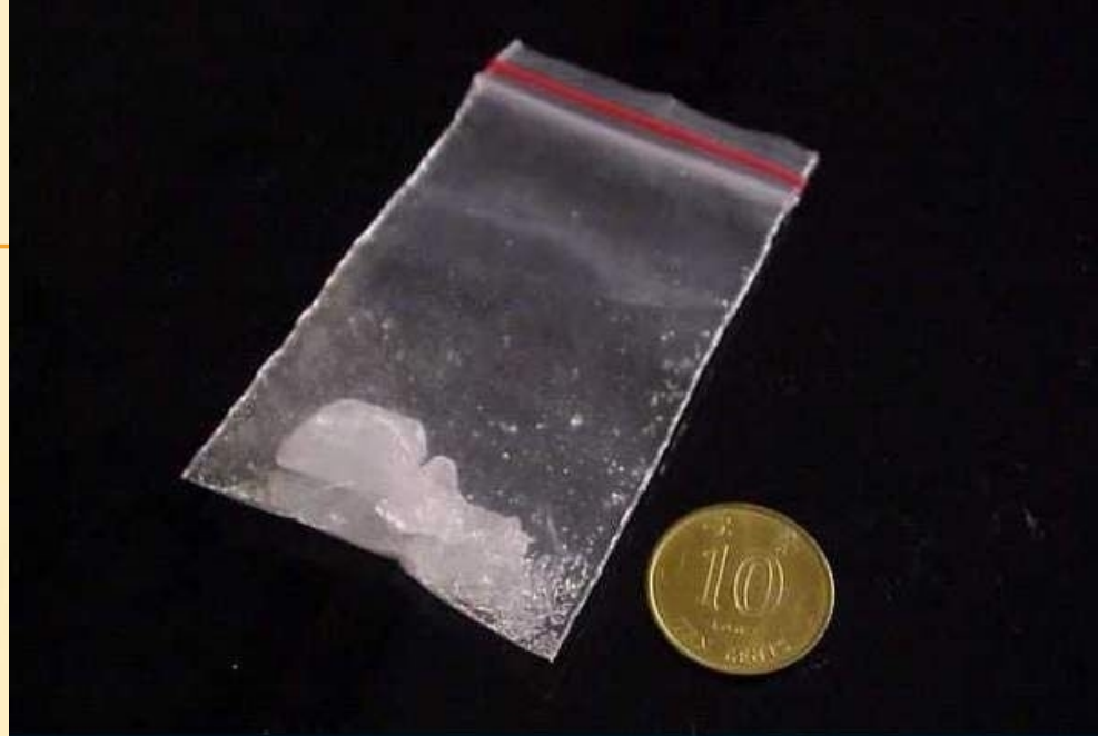
甲基安非他明 Methylamphetamine 俗稱：冰