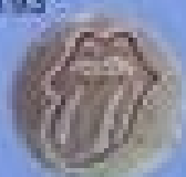
滚石-3 Rolling Stone-3