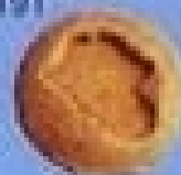
滚石-1 Rolling Stone-1