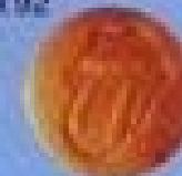
滚石-2 Rolling Stone-2