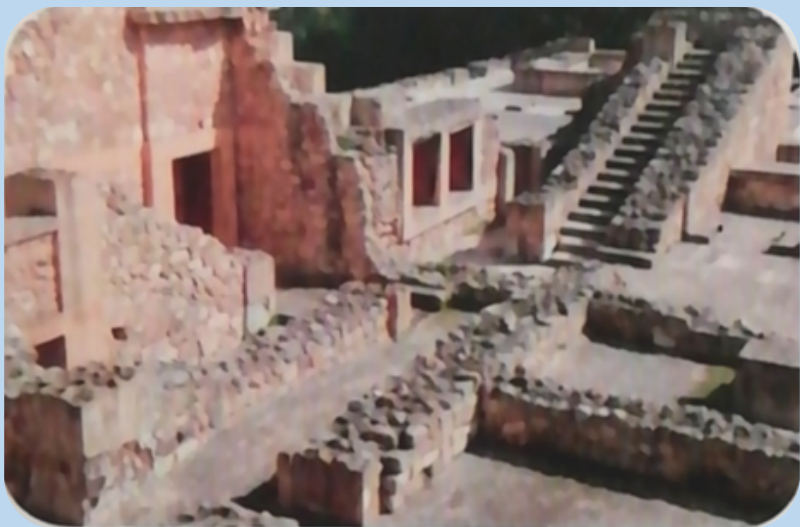
▲ 克里特岛上的一处遗址

希腊克里特岛有着辉煌的古代文明，这里的一些城邦，很早就有习惯法，也出现了成文法。在当地的一处遗址中，发现了公元前7世纪的石刻，上面的铭文记载了有关法律的内容。这就是早期的成文法。